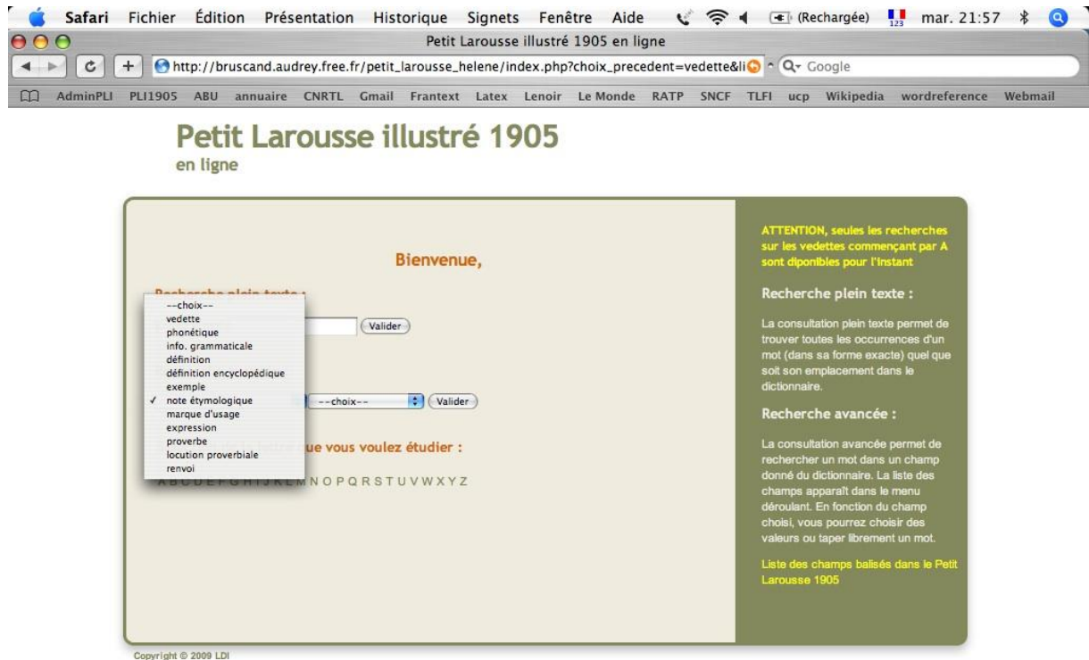
Figure 1. Interface d'interrogation de la base