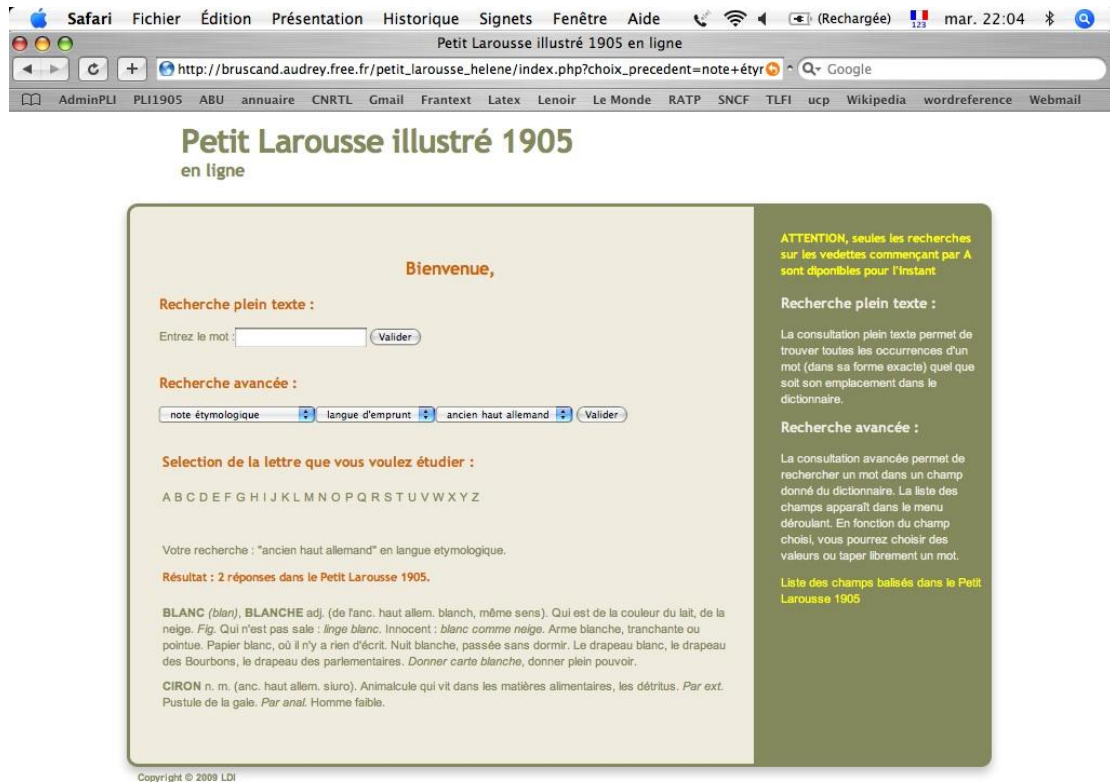
Figure 3. Résultat de la recherche sur les mots ayant l'ancien haut allemand pour origine